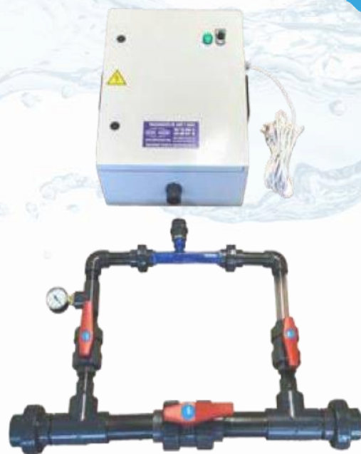
Equipo de ozono para piscinas Mod. Aqua 1