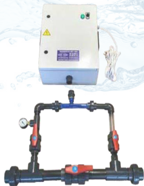
Equipo de ozono para piscinas Mod. Aqua 1