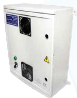
OZOGRAM 1000, 2000, 3000