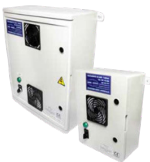
OZOGRAM 400 Y 800