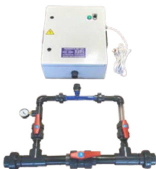
AQUA + VENTURI